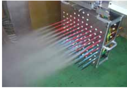
写真: 11 × 8 パネルカセット仕様 スプレ - 吹付け