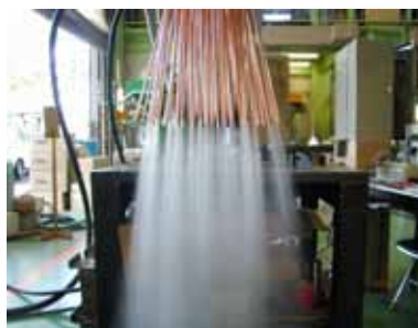
写真: 40 × 4 スプレ - 吹付け