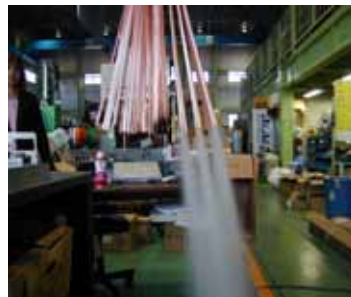
No1スプレ - 吹付け時