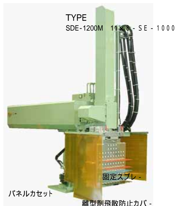
写真: 上下スライドストロ - ク 1200mm 横スライドストロ - ク 1000mm

パネルカセット・固定スプレ - ・離型剤飛散防止カバー・金型登録数追加・御指定塗装色