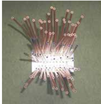
写真: 40 × 4 ~ 550mm